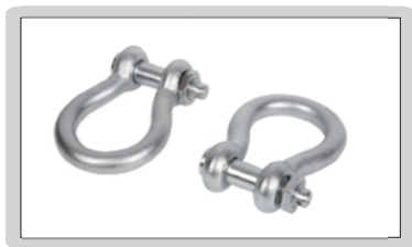
电子吊秤拉环 (选配)